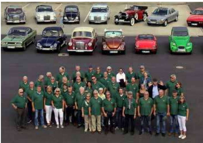
Gruppenfoto der Oldtimerfreunde, Foto: Heinz Laumann

Ulrich Herlitz/Geschichtsverein Grevenbroich